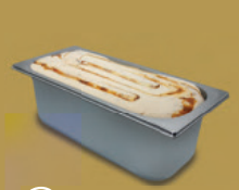
Gastroeis 5,0 L-Schale Art.-Nr.

Vanille Milcheis mit Bourbon-Vanille Extrakt