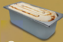
Gastroeis 5,0 L-Schale Art.-Nr.