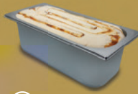
Gastroeis 5,0 L-Schale Art.-Nr.