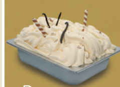
Bergeeis 9,5 L-Schale Art.-Nr.